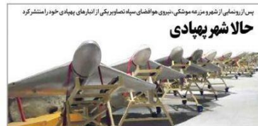
حالا شهر پهپادی

تکذیب خبرسازی جدید «رویترز» درباره اظهار نظریکی از مقامات ایرانی