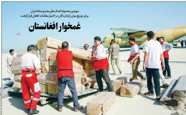
سومین محموله کمک‌های بشردوستانه ایران برای توزیع میان زلزله‌زدگان در اختیار مقامات افغان قرار گرفت

بر اساس برنامه دولت، درآمد ترانزیتی در سال جاری ۲۰ میلیارد دلار خواهد بود که این عدد ۱۶ برابر فروش نفت در سال ۱۳۹۹ است