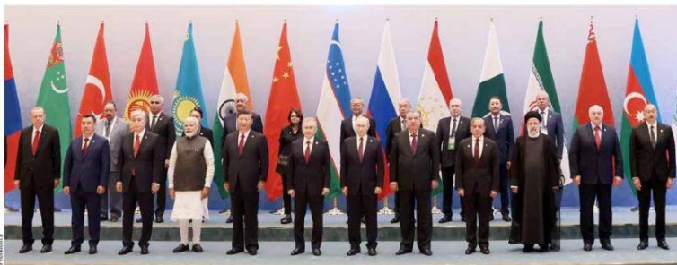
رئیس جمهور کشورمان پس از سفر به سمرقند و دیدار با مقامات عالی «۱۰ کشور» جهان اعلام کرد