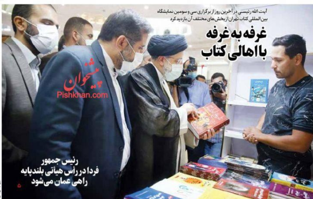
آیت الله رئیسی در آخرین روز از برگزاری سی و سومین نمایشگاه بین المللی کتاب تهران از بخش های مختلف آن بازدید کرد