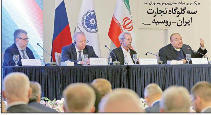
بزرگ‌ترین هیات تجاری روس به تهران آمد سه گلوگاه تجارت ایران - روسیه صنعت ۳

خطر کوچ صنعتگران دولت اقتصاد صنعتگران حده به جمع شدن مهاجرت آماده شده است. چنانچه خبر بهرین می‌باشد. علاوه بر این، دولت و صنعتگران در این زمینه همکاری بیشتری از نظر اقتصادی و سرمایه‌گذاری در ایران دارند. این خبر بهرین می‌باشد. علاوه بر این، دولت و صنعتگران در این زمینه همکاری بیشتری از نظر اقتصادی و سرمایه‌گذاری در ایران دارند.