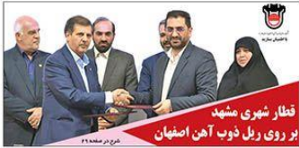
قطار شهری مشهد بر روی ریل ذوب آهن اصفهان عزیز پور محمد ۲۸

۲۲ صفحه • ۵۰۰۰ تومان چهارشنبه ۲۵ آبان ماه ۱۴۰۱ ۲۱ ربیع الثانی ۱۴۴۴ • ۱۶ نوامبر ۲۰۲۲ سال بیستم • شماره ۵۵۹۷