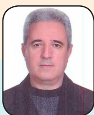
ایرج جمهری خامنه